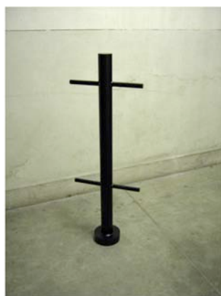
« Faites comme chez vous », 2007

Cette structure, ré architecturée à outrance, devient un objet aux caractéristiques quasi militaires, que l'on imagine clairement fait pour un espace intérieur (où elle perd sa fonction de base)