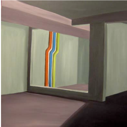
« Sans titre », 2007, Acrylique sur toile, 120 x 120 cm

Au final, le regard sur ces éléments oscille entre une sorte de projection du « dernier paysage » en cas de catastrophe, et une sorte d'enchantement de la contemplation de ces espaces hermétiques atypiques, vides de tout surplus, à l'architecture minimale.